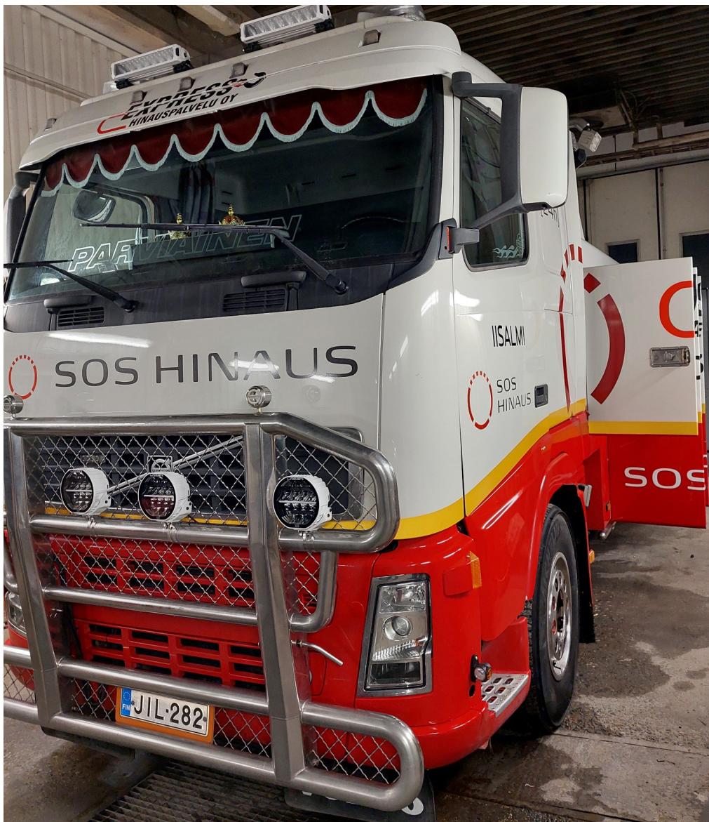
Kuva 1: Raskas hinaustyökalu