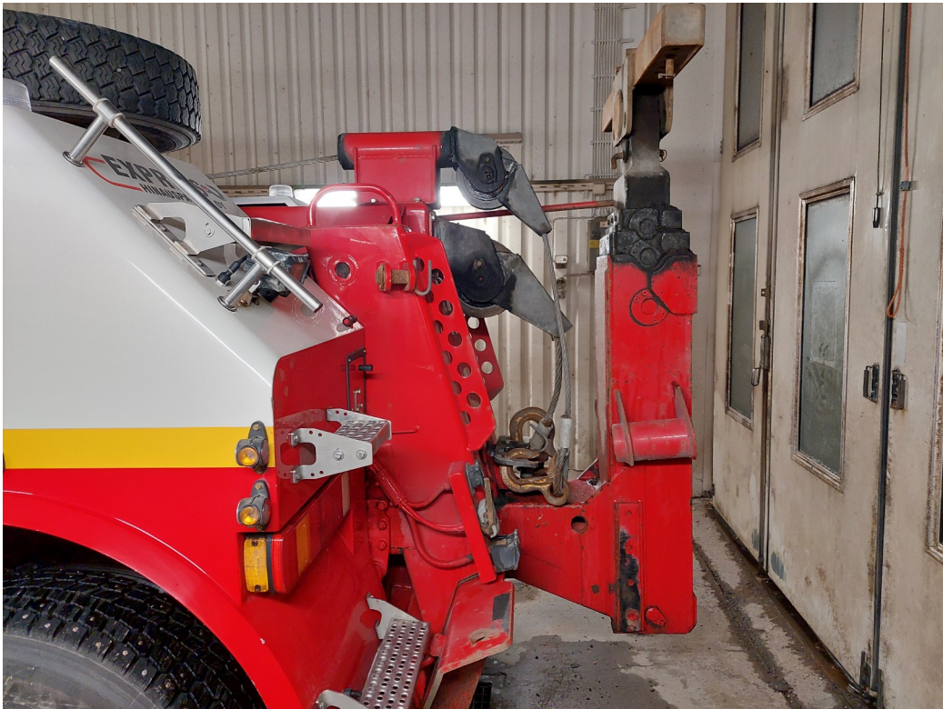
Kuva 2: Tähän tarttuu