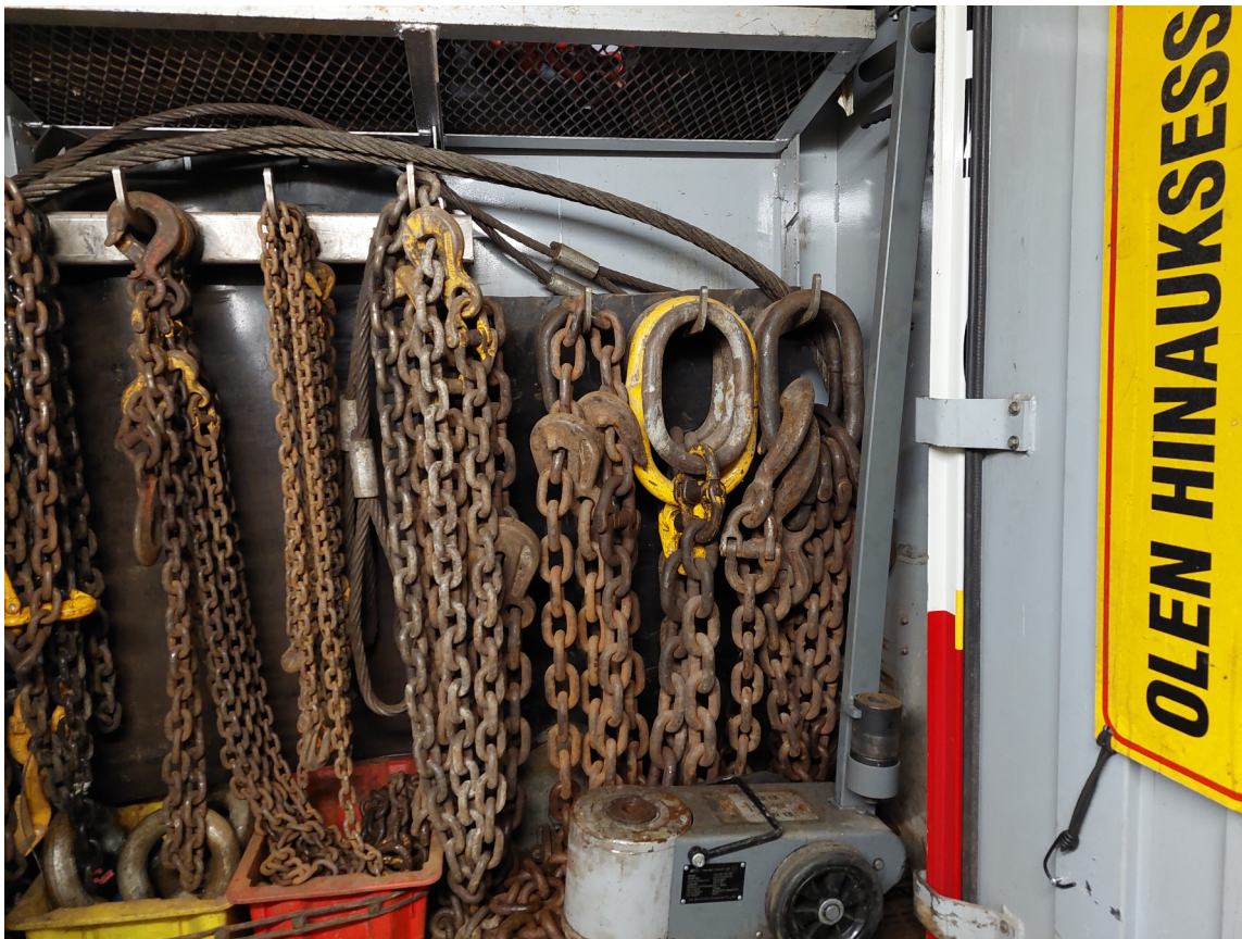
Kuva 4: Monenlaista tarvitaan tässä työssä