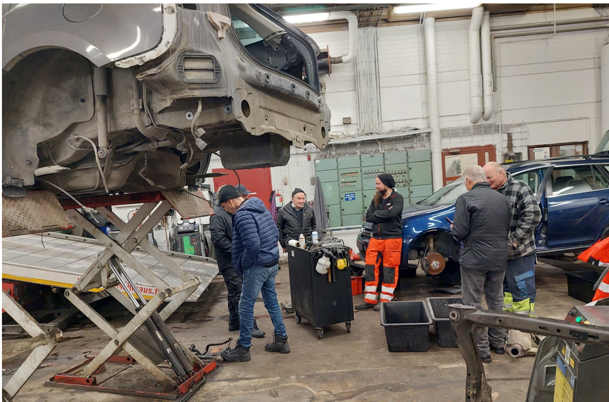
Kuivaus ym tilaa