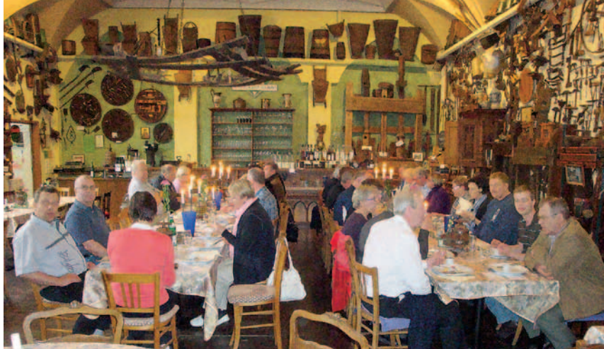
Senheimin vierailukohteessa ruokailtiin viinitila Schlagkampilla.

Yhtiön pääkonttori sijaitsee Rüsselsheimissä, lisäksi tehtaita on Bochumissa ja Eisenachissa. Myös Suomessa on valmistettu Opel Calibraa vuosina 1991–1997. Meidän vierailum-