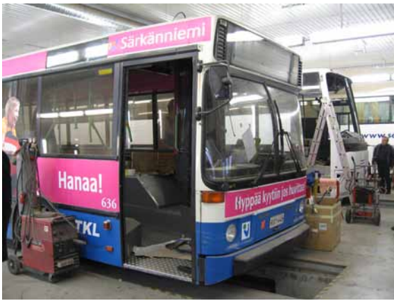
Tampereen liikennelaitoksen Särkänniemen bussi peruskorjauksessa.