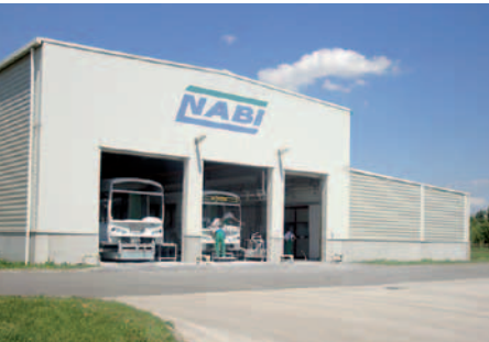
Nabin linja-auton koritehdas.