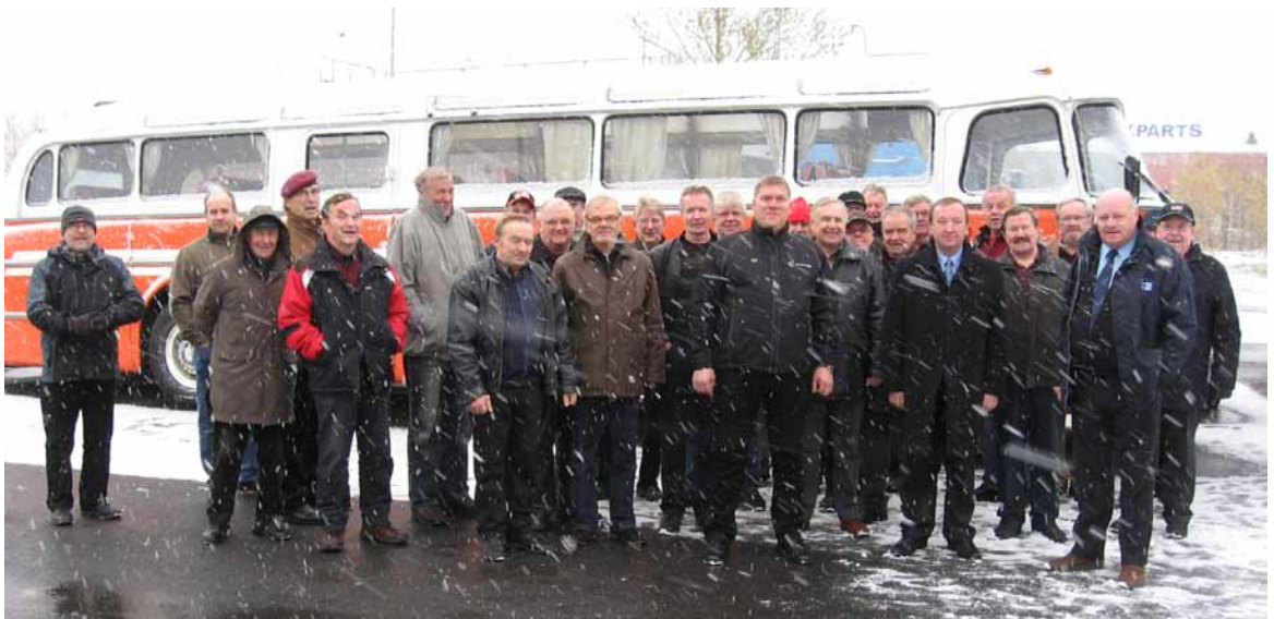
Ryhmäkuva Karlan korjaamon pihalla, taustalla näky entisöity venäläinen bussi.

Ensimmäisenä kohteena oli Tallina Bussijaam eli linja-autoasema ja matkahuolto. Lippu-