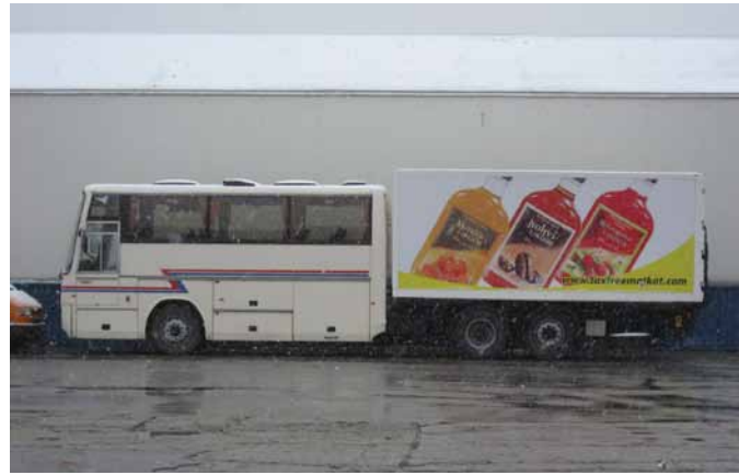
Tällainen sekajunayhdistelmä nähtiin marketin pihassa.

ja linja-autoihin voi ostaa netistä tai puhelimella. Erikoista oli se, että yli 60-vuotiaat saavat 60% alennuksen arkisin hiljaisemmissa vuoroissa. Samassa rakennuksessa, sen toisessa päässä sijaitsi matkahuolto eli Oü Cargo buss. Toimintaa yrityksellä on 27:ssä kaupungissa. Yritys kuljettaa ihmisiä ja tavaraa 26 bussilla, joihin voidaan liittää tarvittaessa perävaunu. Lisäksi käytössä on myös pakettiautoja. Yrityksellä on yli 250 jakelukohdetta ja päivittäin kuljetetaan noin 500 000 pakettia. Yrityksen liikevaihto on 1,8 milj.€ ja se työllistää 46 henkilöä.