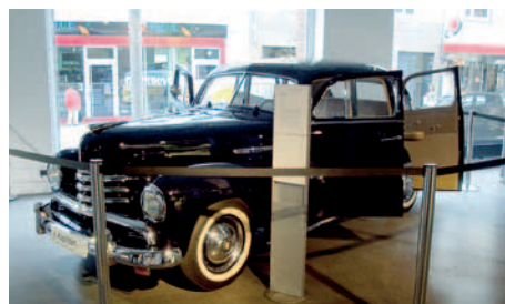
Opelien Rüsselsheimin tehtaalla Opel Foorumilla oli näytillä ensimmäinen Opel Kapitän vuodelta 1952.

Mainzin kaupunkia, jossa osa ryhmästämme kävi ostoksilla. Lounas nautittiin Mainzissa Proviand Magazinesissa. Lounaan jälkeen teimme kävelykierroksen vanhassa kaupungissa ja vierailimme St. Stephanin kirkossa, jossa on hienona nähtävyytenä taiteilija Marc Chagalin luomat vaikuttavat siniset ikkunat.