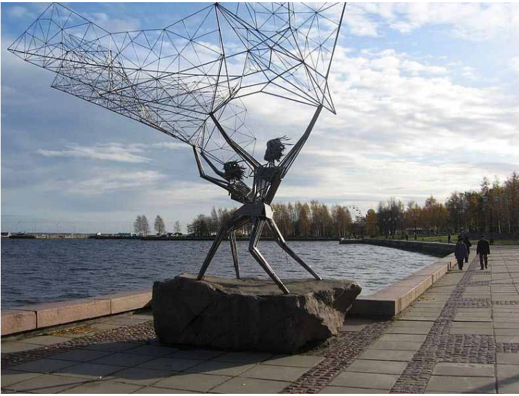
Petroskoin rantabulevardia, taustalla matkustajasatama.