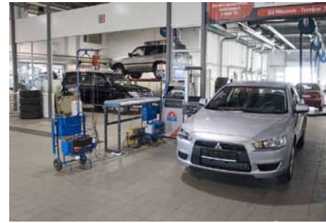
CTK-autotalon ajantasainen korjaamohalli.

Autot tulevat sisään kahden pesupaikan kautta, joissa jokainen auto pestään sekä alta että päältä ennen huoltoa. Korikorjausosastolla on täydellinen korinoikaisulaitteisto ja myös automaalaamo pölynpoistolaitteistoinen ja uuneineen on huipuluokkaa. Rakennuksen toisessa kerroksessa ovat nykyaikaiset sosiaalitulit saunoineen. Pohjakerroksessa on myös varavoima-asema, joka hyrähtää käyntiin automaattisesti sähkökatkoksen tapahtuessa.