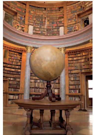
Pannonhalman luostarin kirjasto.

Neljäntenä päivänä vierailimme Nabin linja-autokoritehtaalla. Vierailu osoittautui erittäin mielenkiintoiseksi johtuen omasta taustastani ja edellisten vuosien rypistyksestä ajoneuvoprojektin parissa. Nabi valmistaa itsekantavia hiilikuitukoreja linja-autoihin Amerikan markkinoille. Oli vaikuttava näky, kun parikymmentä ihmistä työskentelee yhden linja-auton korin puolikkaan kimpussa laminoiden hiilikuitua. Nabi