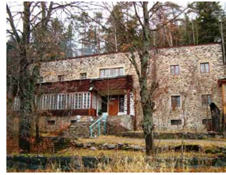
Apteekkari Jääskeläisen huvila vuodelta 1935 on yksi alkumatkan nähtävyyksistä. Se toimii nykyisin taiteilijakotina.