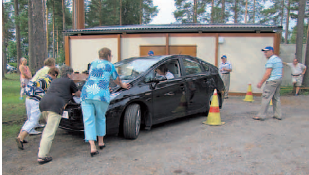
Piirikilpailussa naisten oma joukkue oli vahvimmillaan hybridiauton työntö-kisassa.

Osa Powerparkin esityksistä olivat hyvinkin ilmavia.