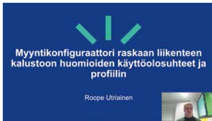
Toiseksi sijoittui Roope Utriainen Oulun yliopistosta.

Kyselytutkimuksena saatujen vastausten perusteella yleisissä työelämätaidoissa keskeisiä tarvittavia taitoja ovat viestintä, jatkuva oppiminen ja itsensä johtaminen ammatillisen menestyksen kannal-