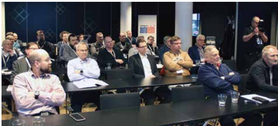
Liittokokouksen kokousedustajia seuraamassa kokouksen kulkua.

Liittokokouksessa päätettiin niin liiton omien sääntöjen muutoksista kuin SATL:n paikallisyhdistyksinä toimivien Autotek-