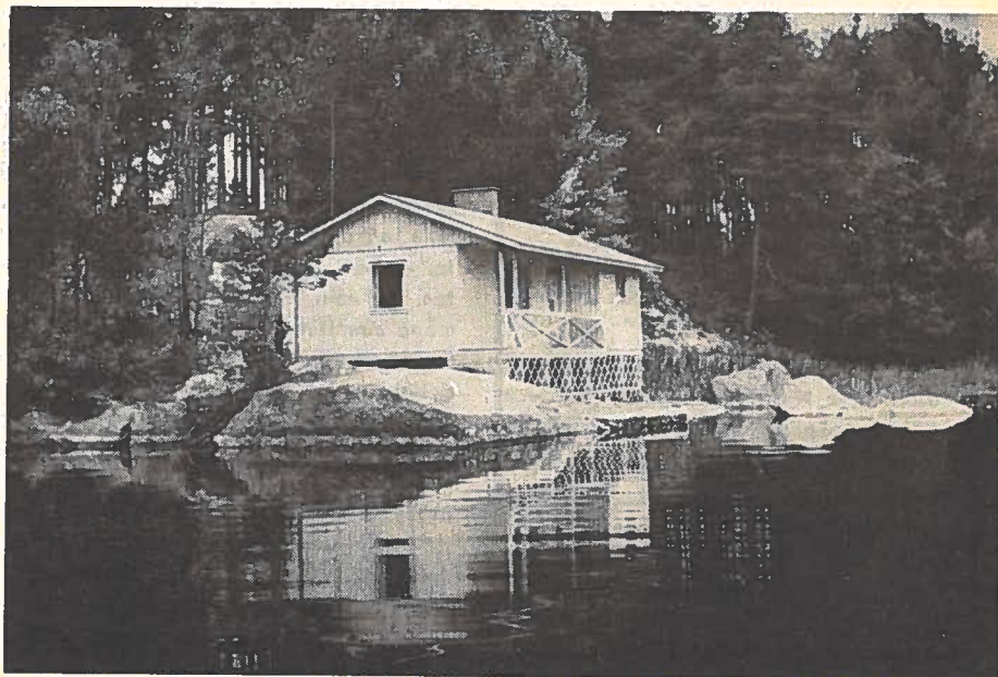
Kotkan Seudun Auto- ja Moottoritekni- kot ovat puhdetöinä rakentaneet oman saunan.