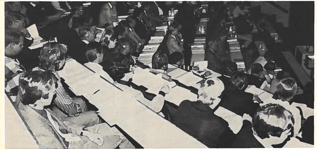
Rengaspäivillä oli ennätysellinen osanottajamäärä kuulemassa mielenkiintoisia esityksiä alan kehityksestä.