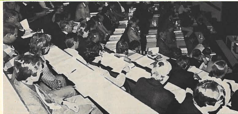
Rengaspäivillä oli ennätysellinen osanottajamäärä kuulemassa mielenkiintoisia esityksiä alan kehityksestä.