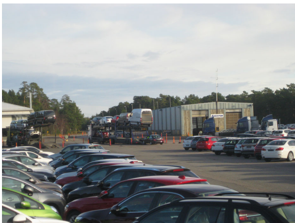
Assistor Oy Hangon vapaasatama.