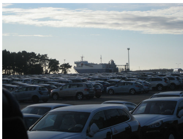
Suuret laivat tuovat tuhansia autoja kerralla.