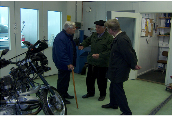
Lastusilta, Vasama ja Vigelius.