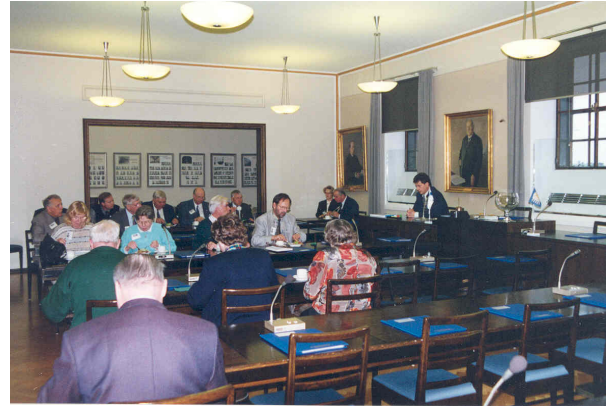
Seniorit oikeusministerin tarjoamalla kahvilla

Nokian matkapuhelimet Salo, Nokian rengastehdas Nokia ja tutustuminen Eduskunta taloon ja täysistuntoon Oikeusministeri Sauli Niinistön isännöidyellä.