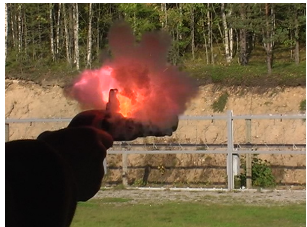
Hevonpään ampumaradalla mustaruutiaseita kokeilemassa.