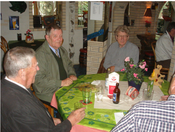
ja Keppanakellarissa Tammelassa.