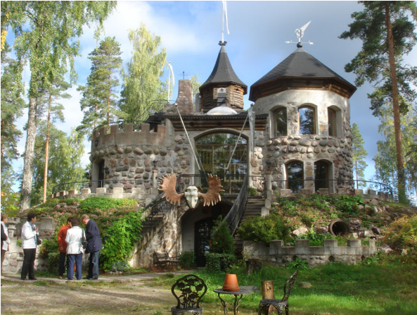
Seniorit Hiidenlinnassa Somerniemellä.