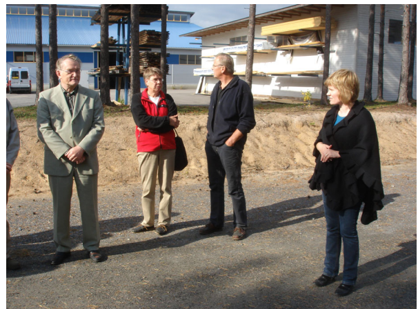
Teijo-Talot Oy tehtaalla.