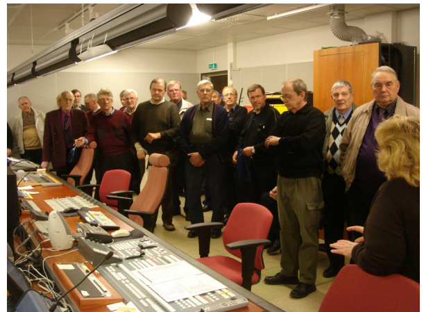
Seniorit Tohlopissa Tampereella

14.2. Yhdistyksen vuosikokous Op:n tiloissa.