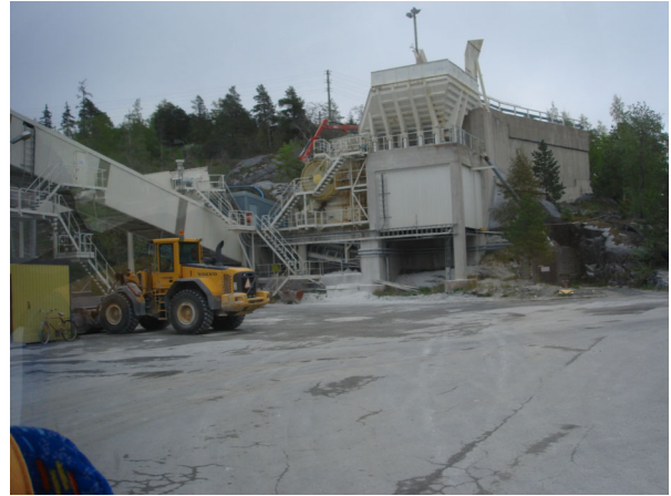
Lekamurskain Förbyn kalkkikaivoksella.