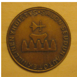
Lastusillan suunnittelema ansiomitali.

Merkkipäiviään juhlineita kerhon jäseniä on muistettu onnittelukäynnein, ansioimerkein, kukkasin ja adressein.