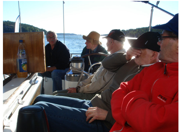
Purjehtimassa Hagströmin purjeverneellä.