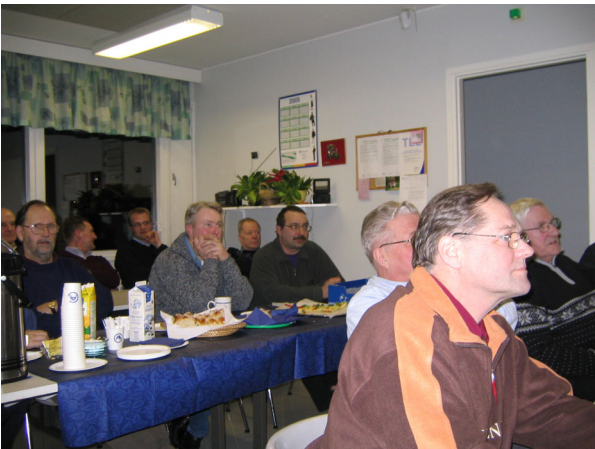
Vieraina Salon katsastusasemalla

Bosch-tuote-esittely Virtasen Moottori Oy:ssa, Seniorikerhon kevätisteily, Vierailu SSP : n kaapeli-TV yhtiöön Salossa, Vierailu Agri-marketissa Salossa, Syyskauden avajaiset Kolopirtillä Kiikalassa, Vierailu Loglif Oy:ssa Salossa, Tutustumiskäynti Nordic Aluminium Oy:n laitoksiin Kirkkonummella, Seniorikerhon syysisteily, Vierailu Carrys Oy:n tehtailla Liedossa, Vierailu Salon katsastusasemalla, Seniorien vierailu Kynttilätuote Oy:n tiloissa Halikossa, Vierailu Keskus-Autohallin tiloissa Salossa.