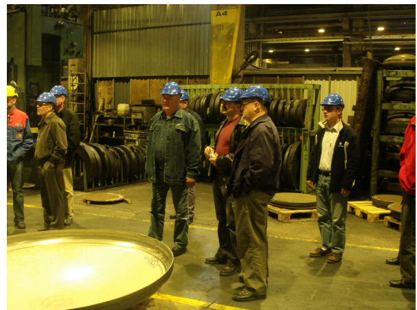
Tutustumassa Halikko Works Oy säiliönpääty tuotantoon.