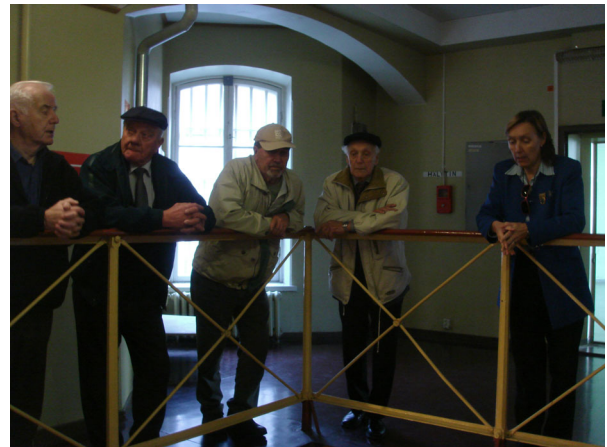
Turun Kakolan vankilassa.