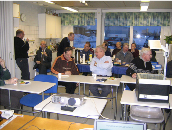
Vierailu A-katsastuksen tiloissa