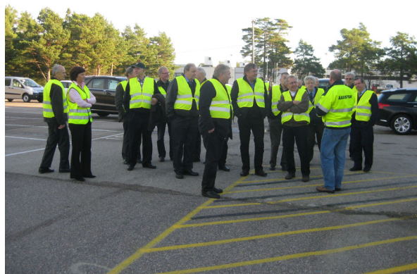
Seniorit Assistorin vieraina Hangossa.