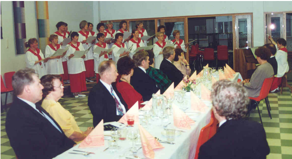
SSATY:n 50 vuotisjuhla 23.4.2005. Hoiturikuoro ja juhlayleisöä.