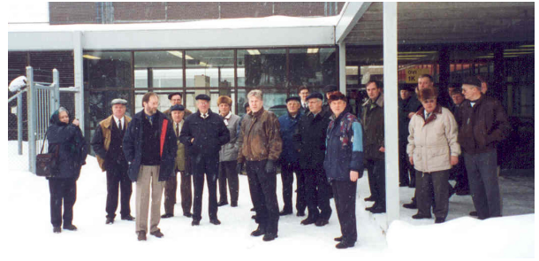
Matkalla IVO:n ydinvoimalaan Loviisaan 1999.

Tutustuminen Parolan Panssari- ja autokorjaamoon, Sijoitusneuvontaa Leonia pankissa.